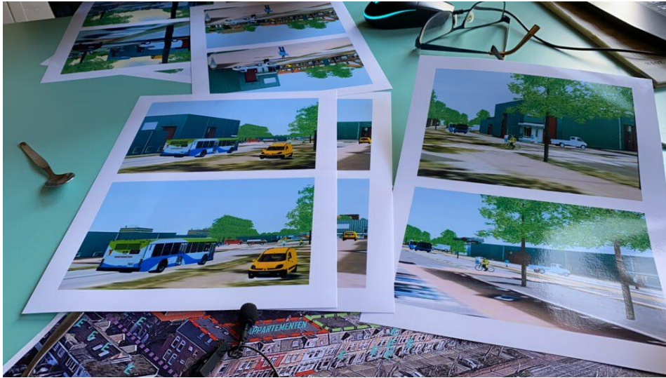
3D-tekeningen van Bram van Duinen.